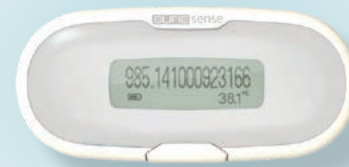
UNIVERSAL MICROCHIP READER