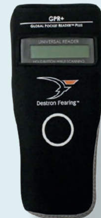
GLOBAL POCKET READER PLUS